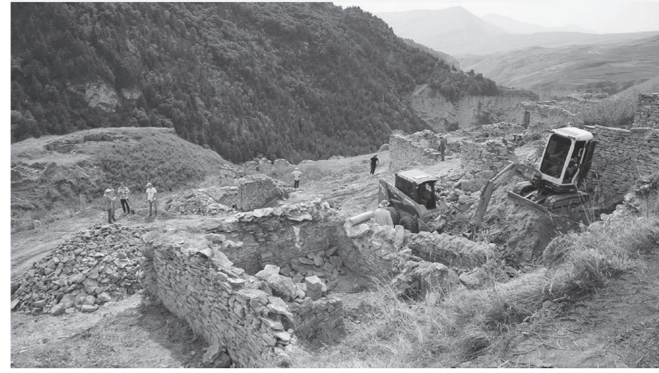
возрождению национальных памятников архитектуры уделяет особое внимание. Одним из направлений в этой деятельности является реконструкция историко-архитектурного комплекса Хой (Веденский район), который по распоря-

В своей деятельности Глава Чеченской Республики Рамзан Кадыров, сохраняя преемственность поколений,